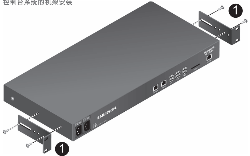
控制台系统的机架安装