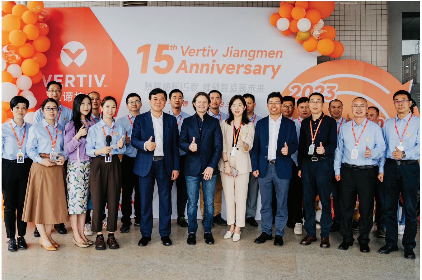
15th Anniversary of Vertiv Jiangmen. Jiangmen, China, 2023.

视。这一理念适用于与招募、招聘、晋升、转岗、解雇、终止合同、薪酬、福利、培训(包括实习)、评级、认证、测验、留任、转推荐,以及招聘其他方面相关的决策。招聘决策只能基于 Vertiv 的需求、职位要求以及个人资质,同时还须适当强调多元化的重要性以及为空缺职位招聘到最佳人选。