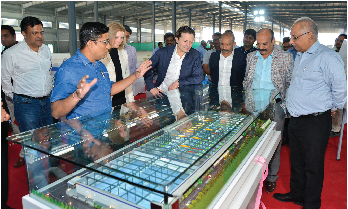
Visit of the CEO, Vertiv Manufacturing Facility, 2024. Chakan, Pune, India.

如果您認為自己或您認識的人曾經或正在面臨騷擾行為，請立即向您的經理、當地人力資源部門或第 5 頁「如何獲得協助或報告疑慮」所列的聯絡管道舉報。如果發現任何涉嫌違反本準則或其他法律或政策的行為，請隨時舉報。您不必擔心自己的工作會受到不利影響，因為 Vertiv 嚴格禁止報復善意舉報潛在違規行為之人。若要進一步了解關於這點的更多資訊，請參閱第 6 頁的「禁止報復」部分。