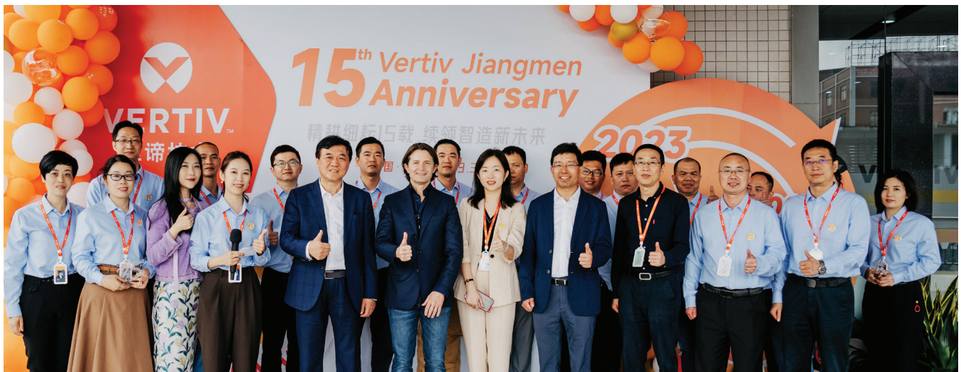
15th Anniversary of Vertiv Jiangmen. Jiangmen, China, 2023.