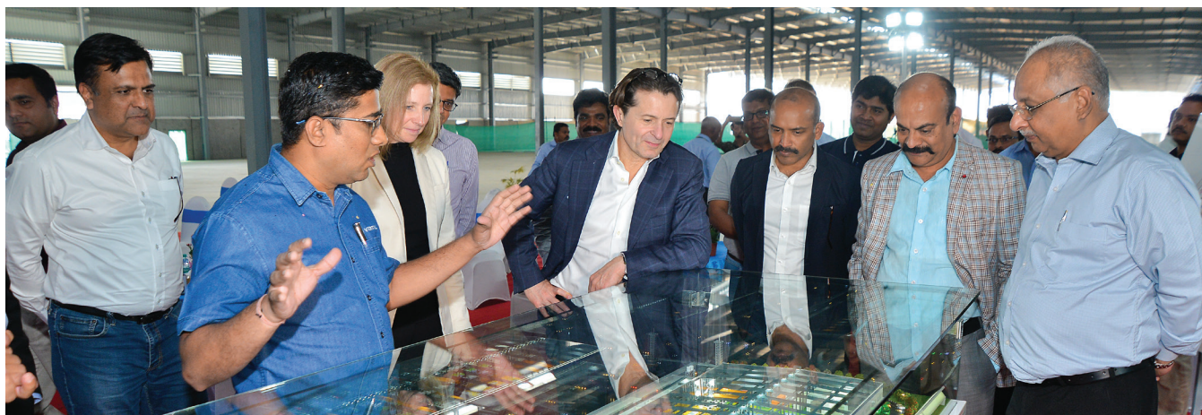
Visit of the CEO, Vertiv Manufacturing Facility, 2024. Chakan, Pune, India.

Vertiv respectă și apreciază diversitatea și depune eforturi pentru a furniza un mediu de lucru incluziv ce este pozitiv, productiv și bazat pe respect. De asemenea, dorim să nu existe nicio formă de comportament inadecvat, discriminare sau hărțuire la locul de muncă. Hărțuirea include comportamentul ofensator care interferează cu mediul de lucru al unei alte persoane sau care ar crea un mediu de lucru ofensator, intimidant sau ostil. Comportamentul va fi considerat hărțuire indiferent dacă este manifestat fizic sau verbal și indiferent dacă este manifestat personal ori prin alte mijloace (precum mesaje, postări pe platformele de comunicare socială, e-mailuri sau mesaje text).