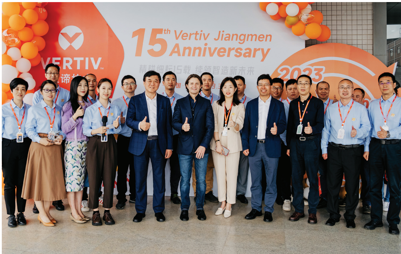
15th Anniversary of Vertiv Jiangmen. Jiangmen, China, 2023.