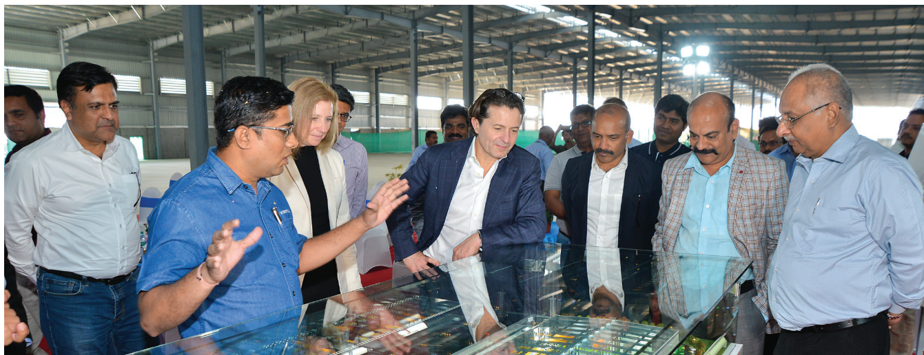
Visit of the CEO, Vertiv Manufacturing Facility, 2024. Chakan, Pune, India.

Společnost Vertiv respektuje a oceňuje rozmanitost a snaží se vytvářet inkluzivní pracovní prostředí, které je pozitivní, produktivní a vyznačuje se projevy respektu. Chceme také, aby se na pracovišti nevyskytovaly žádné formy nevhodného chování, diskriminace nebo obtěžování. Obtěžování je urážlivé chování, které narušuje pracovní prostředí jiné osoby nebo které by mohlo vytvořit urážlivé, zastrašující nebo nepřátelské pracovní prostředí. O obtěžování se jedná bez ohledu na to, zda je prováděno fyzicky nebo verbálně a zda je prováděno při osobním kontaktu nebo jinými prostředky (například prostřednictvím poznámek, příspěvků na sociálních sítích, e-mailů nebo textových zpráv).