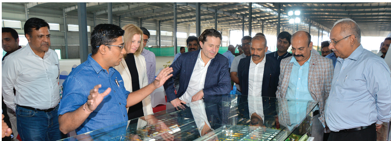
Visit of the CEO, Vertiv Manufacturing Facility, 2024. Chakan, Pune, India.

Vertiv respeta y valora la diversidad y se esfuerza por proporcionar un entorno de trabajo inclusivo que sea positivo, productivo y se caracterice por el respeto. Asimismo, queremos vernos libres de cualquier tipo de acoso, discriminación y conducta inapropiada en el lugar de trabajo. El acoso incluye todo comportamiento ofensivo que interfiera en el entorno laboral de otra persona o que pudiese crear un entorno de trabajo ofensivo, intimidatorio u hostil. Una conducta se considerará acoso tanto si se lleva a cabo física o verbalmente y tanto si se hace en persona como por otro medio (por ejemplo, a través de notas, publicaciones en redes sociales, correos electrónicos o mensajes de texto).