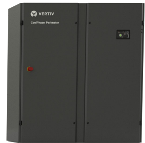
45-60 kW Baugröße 3