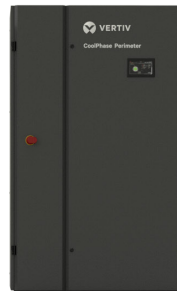
30-45 kW Baugröße 2