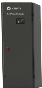
0-15 kW Baugröße 0