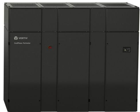
100-160 kW Baugröße 10