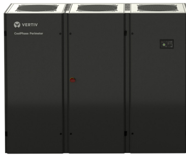
60-100 kW Baugröße 5