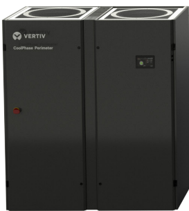
45-60 kW Baugröße 3