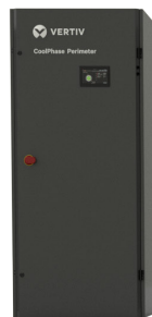
15-30 kW Baugröße 1