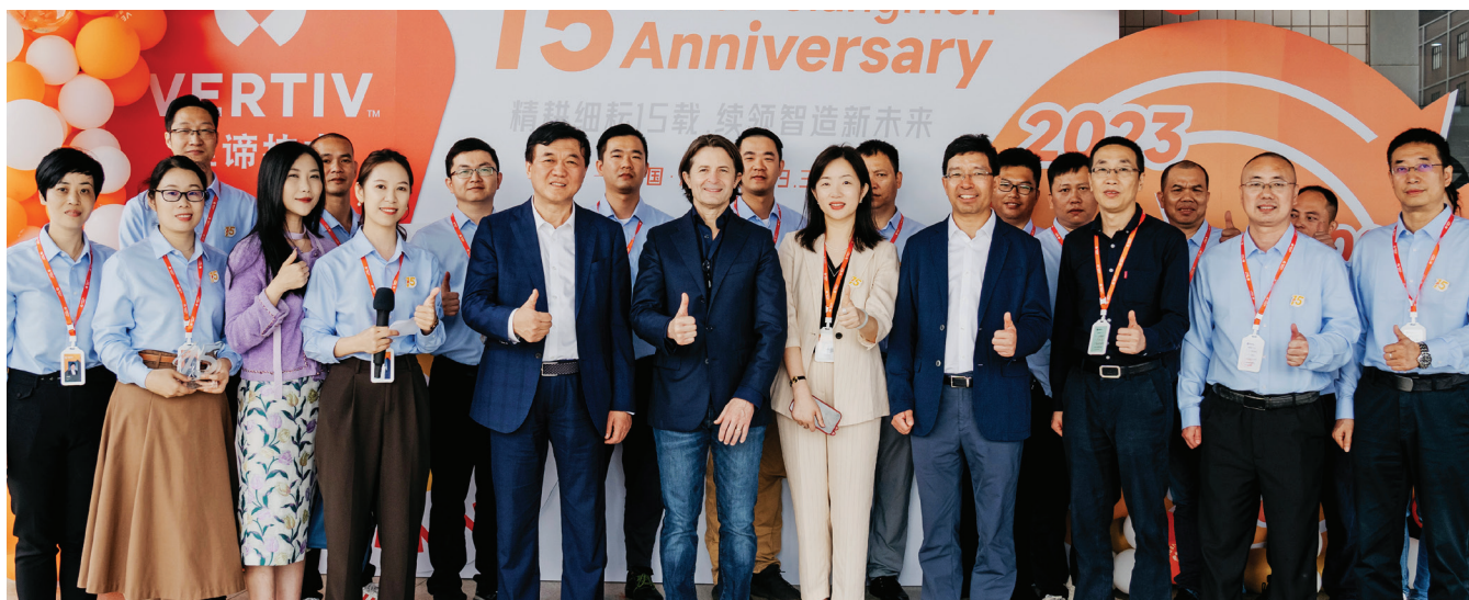
15th Anniversary of Vertiv Jiangmen. Jiangmen, China, 2023.

Vertiv è dedicata alla creazione e promozione di una cultura inclusiva in cui tutti i dipendenti hanno opportunità per crescere, svilupparsi, essere alla guida e dare origine a cambiamenti positivi. Incoraggiamo e invitiamo i dipendenti entusiasti della nostra azienda e cultura a unirsi per aiutare a promuovere i cambiamenti e implementare soluzioni più efficaci. Quando dipendenti dedicati nell'intera azienda collaborano insieme, personificano molti dei nostri valori e comportamenti Vertiv, quali agire come se fossimo i proprietari, sfidare noi stessi in un percorso di sviluppo personale, utilizzare la diversità e promuovere l'innovazione e il cambiamento. Spesso ciò genera soluzioni creative. Una diversità di culture, esperienze e contesti dà origine a una diversità di idee che alla fine apportano vantaggi a Vertiv e a ognuna delle sue parti interessate, creando un futuro migliore per tutti noi. Garantiamo di impegnarci a difendere la diversità, l'inclusione e le pari opportunità non perché sia la cosa legalmente responsabile da fare, ma perché è la cosa giusta da fare e, in sostanza, apporta vantaggi a Vertiv.