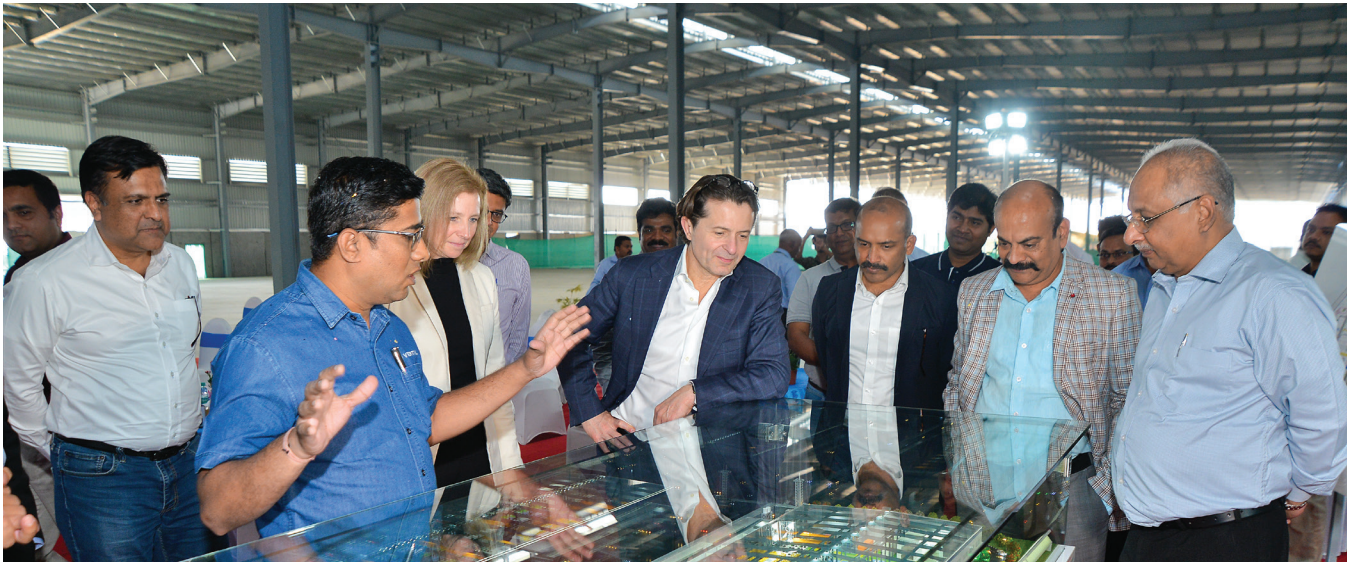
Visit of the CEO, Vertiv Manufacturing Facility, 2024. Chakan, Pune, India.

Se ritenete che voi o qualcun altro che conoscete abbiate dovuto affrontare o stiate affrontando comportamenti molesti, segnalatelo immediatamente al vostro manager, al reparto locale di risorse umane o a uno qualsiasi dei punti di contatto indicati a pagina 6 in “Come ottenere assistenza o segnalare una preoccupazione”. Dovete sentirvi liberi di segnalare qualsiasi violazione sospetta del presente Codice o di un'altra legge o politica senza timore che il vostro rapporto di lavoro subisca effetti negativi. Vertiv vieta rigorosamente atti di ritorsione contro persone che segnalano possibili violazioni in buona fede. Per ulteriori informazioni al riguardo consultate “Divieto di ritorsioni” a pagina 6.