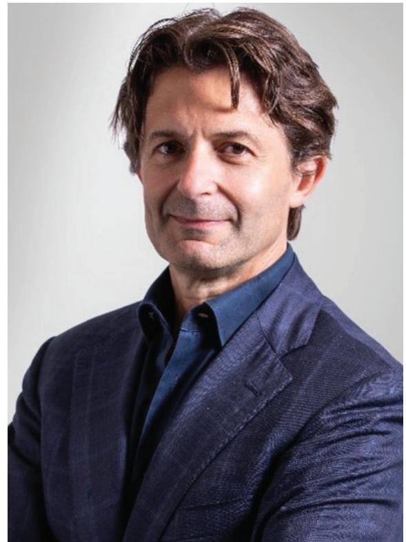
Giordano Albertazzi CEO, Vertiv™

Sono certo che con il proseguire della crescita e dello sviluppo di Vertiv il nostro impegno costante per un'integrità senza compromessi ci consentirà di continuare a fornire valore aggiunto ai clienti, aiutandoci al tempo stesso a creare una cultura dei risultati che non solo ci aiuterà a raggiungere gli obiettivi aziendali, ma ci consentirà di distinguerci come luogo di lavoro apprezzato a livello globale.”