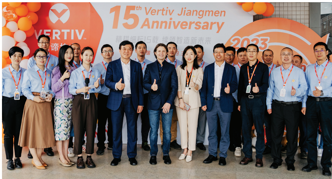
15th Anniversary of Vertiv Jiangmen. Jiangmen, China, 2023.

Vertiv se consacre à la création et à la promotion d'une culture inclusive où tous les employés ont la possibilité de grandir, de se développer, de diriger et d'effectuer des changements positifs. Nous encourageons et invitons les employés passionnés par notre entreprise et notre culture à se réunir pour contribuer au changement et à mettre en œuvre des solutions plus efficaces. Lorsque des employés engagés travaillent ensemble au sein de l'entreprise, ils personnifient bon nombre de nos valeurs et de nos comportements Vertiv, tels qu'agir comme un actionnaire, se remettre en question en matière de développement personnel, tirer parti de la diversité et favoriser l'innovation et le changement. Ils génèrent souvent des solutions créatives en conséquence. Une diversité de cultures, d'expériences et d'origines se traduit par une diversité d'idées qui profitent à Vertiv et à chacune de ses parties prenantes en plus de construire un avenir meilleur pour nous tous. Nous promettons notre engagement envers la diversité, l'inclusion et l'égalité des chances non pas parce que c'est la chose légalement responsable à faire, mais plutôt parce que c'est la bonne chose à faire, et, en fin de compte, cela profite grandement à Vertiv.