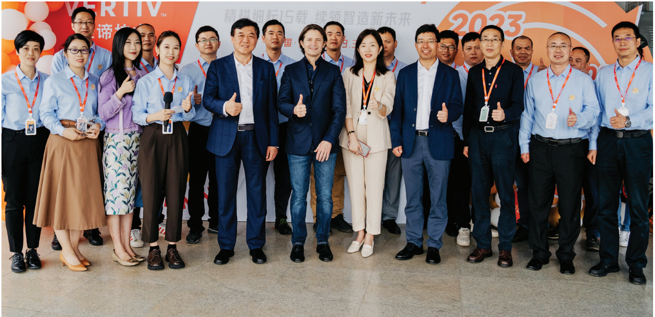
15th Anniversary of Vertiv Jiangmen, Jiangmen, China, 2023.

Vertiv มุ่งงานที่ ทั่วโลก ความหลากหลาย และเรามองหาโอกาสในการเพิ่ม ความหลากหลายนี้บ่อยๆ สมอ คุณอาจช่วยโดยการเพิ่ม ความหลากหลายของกลุ่ม พลั มีคร เป็ ดกวางและตอนรับมมมองและพน ทมก หลากหลาย และเออ อำนวยสำหรับความแตกต่างเหล่านั้นตามความเหมาะสม เช่น การรวมเน้Vอหากางวัฒนธรรมเขาไว้ใน การฝึ กอบรม และการสื่อสาร