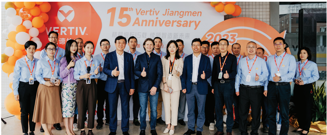
15th Anniversary of Vertiv Jiangmen. Jiangmen, China, 2023.

En consecuencia, Vertiv se compromete a promover la inclusión y la igualdad de oportunidades para todos en lo que respecta a la contratación, las condiciones de empleo, la movilidad, la capacitación, la compensación y la salud ocupacional, sin discriminación en cuanto a edad, raza, color, religión, credo, sexo, estado civil, orientación sexual, identidad de género, información genética, estado de ciudadanía, nacionalidad de origen, condición de veterano protegido, filiación política, discapacidad o cualquier otra condición o característica amparados por la legislación vigente. Esto se aplica a las decisiones de empleo relativas a reclutamiento, contratación, ascenso, transferencia, despido, rescisión, compensación, prestaciones, capacitación (incluido el aprendizaje profesional), clasificación, certificación, retención, derivación y otros aspectos del empleo. Las decisiones laborales se deben basar únicamente en las necesidades de Vertiv, los requisitos del puesto y las cualificaciones del individuo, e igualmente deben proporcionar un énfasis adecuado en la importancia de la diversidad y contratar el mejor perfil para ese puesto.