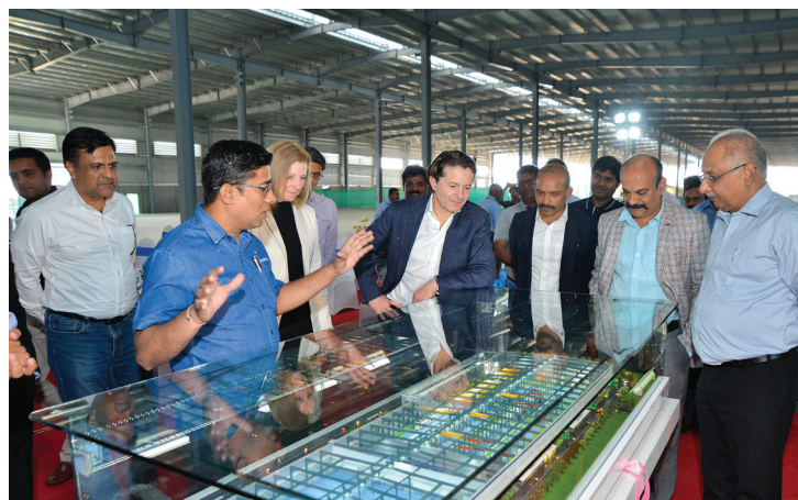
Visit of the CEO, Vertiv Manufacturing Facility, 2024. Chakan, Pune, India.

A Vertiv respeita e valoriza a diversidade e se esforça para fornecer um ambiente de trabalho inclusivo que seja positivo, produtivo e caracterizado pelo respeito. Também queremos que seja livre de todas as formas de comportamento inadequado, discriminação ou assédio. O assédio inclui comportamento ofensivo que interfere no ambiente de trabalho de outra pessoa ou que cria um ambiente de trabalho ofensivo, intimidador ou hostil. A conduta será considerada assédio, independentemente de ser feita de forma física ou verbal e proferida de forma pessoal ou por outros meios (como por notas, publicações em mídias sociais, e-mails ou mensagens de texto).