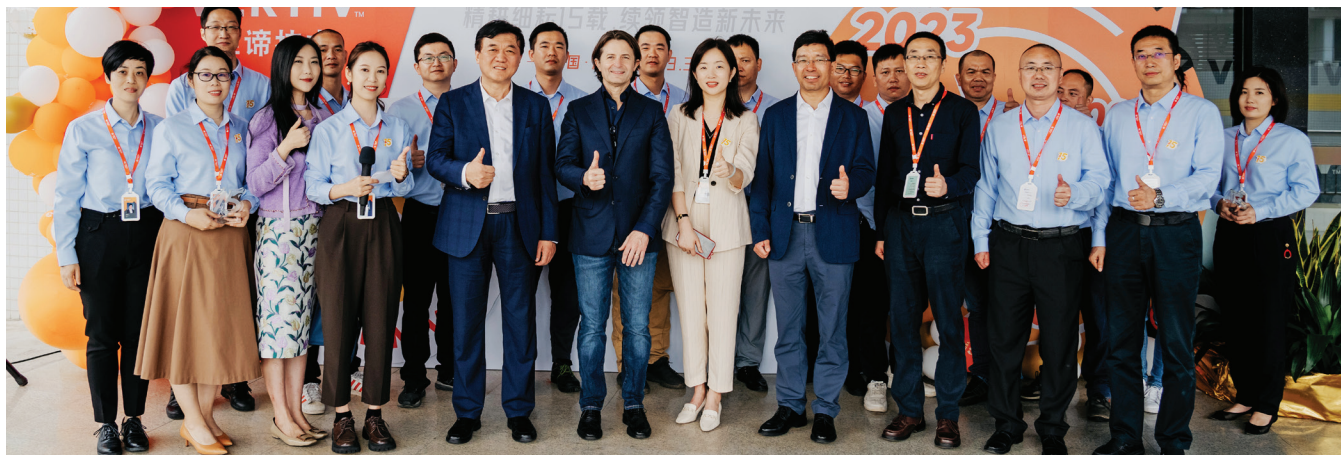
15º Aniversário da Vertiv Jiangmen. Jiangmen, China, 2023.

A Vertiv dedica-se a desenvolver e promover uma cultura inclusiva em que todos os colaboradores têm oportunidades de crescer, desenvolver-se, liderar e fazer mudanças positivas. Incentivamos e convidamos nossos colaboradores, que são apaixonados por nossa empresa e cultura, a se unirem para ajudar a impulsionar a mudança e implementar soluções mais eficazes. Quando colaboradores comprometidos em toda a empresa trabalham juntos, eles personificam muitos dos valores e comportamentos da Vertiv, como assumir uma atitude de proprietário, desafiar-se no desenvolvimento pessoal, promover a diversidade e impulsionar a inovação e a mudança. Como resultado, eles costumam produzir soluções criativas. A diversidade de culturas, experiências e conhecimentos resulta em diversidade de ideias que, em última análise, beneficia a Vertiv e cada uma de suas partes interessadas, além de construir um futuro melhor para todos nós. Assumimos um compromisso com a diversidade, a inclusão e as oportunidades iguais, mas não por ser uma simples responsabilidade jurídica e sim por ser o certo a fazer e por que, em última análise, isso beneficia a Vertiv.