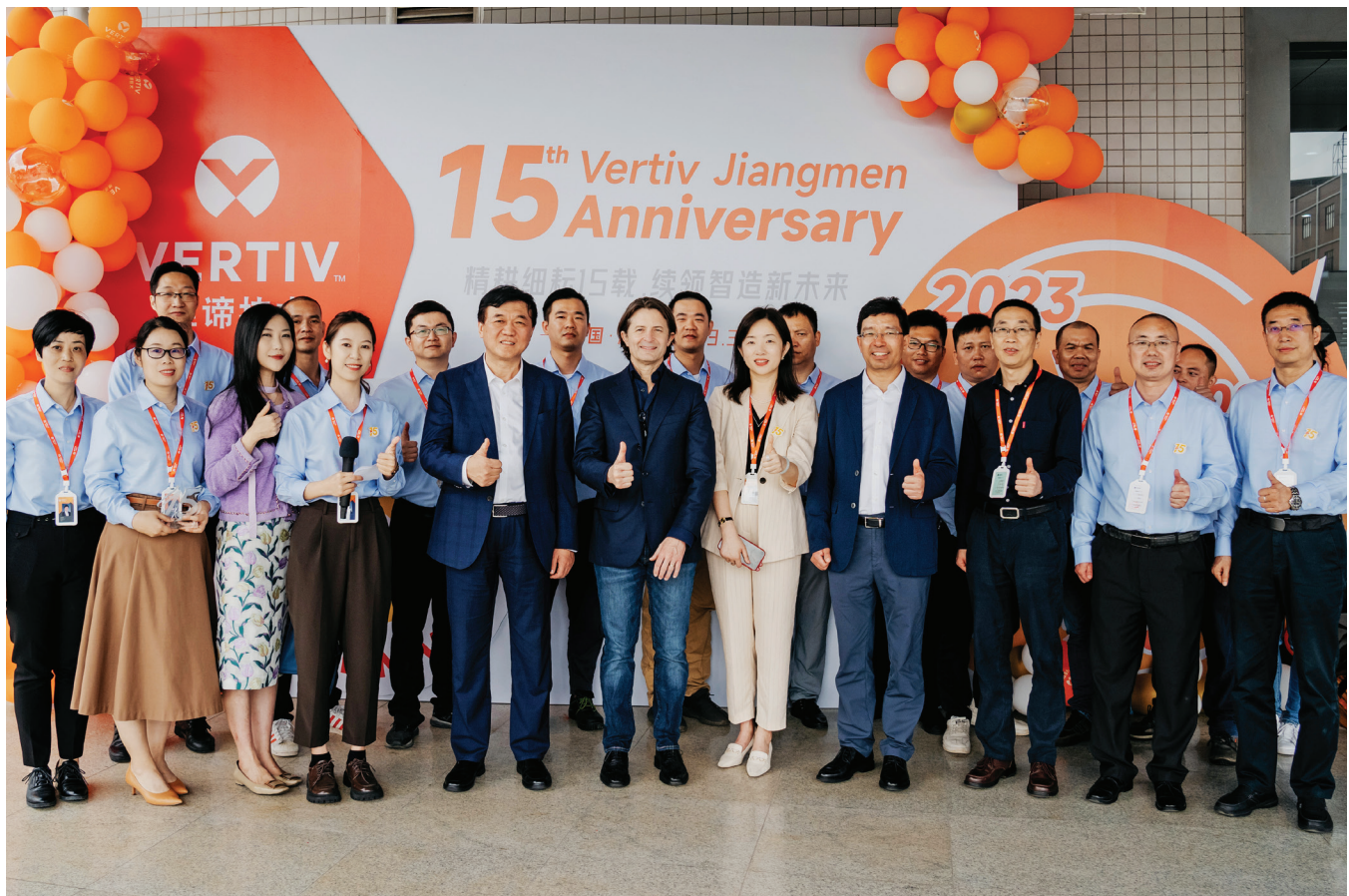
A Vertiv Jiangmen alapításának 15. évfordulója. Jiangmen, Kína, 2023.