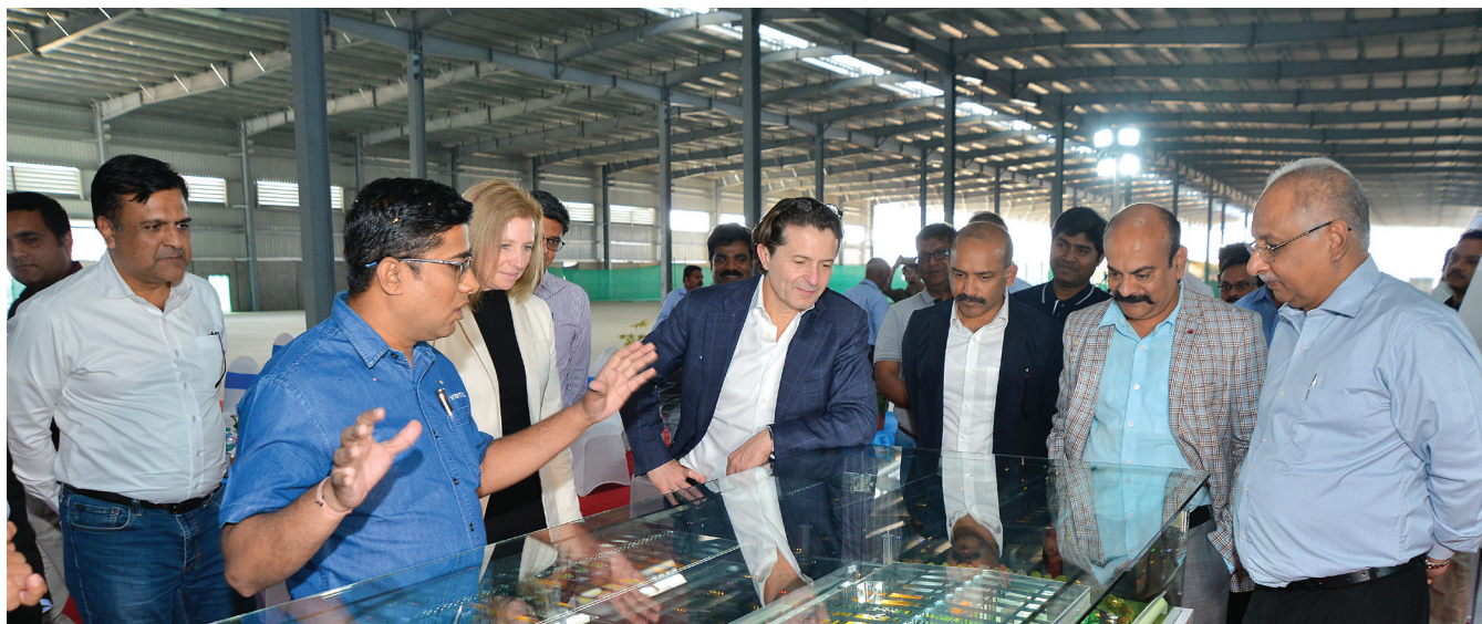
Vezérigazgatói látogatás a Vertiv gyártóüzemében, 2024. Chakan, Pune, India.

A Vertiv tiszteltben tartja és értékeli a sokszínűséget, és arra törekszik, hogy pozitív, produktív és tiszteleten alapuló, befogadó munkakörnyezetet biztosítson. Arról is gondoskodni kívánunk, hogy semmilyen formában ne kerülhessen sor helytelen munkahelyi viselkedésre, diszkriminációra vagy zaklatásra. Zaklatásnak minősül az olyan sértő magatartás, amely megzavarja egy másik személy munkakörnyezetét, vagy amely alkalmas arra, hogy sértő, megfélemlítő vagy ellenséges munkakörnyezetet teremtsen. A viselkedés zaklatásnak minősül, függetlenül attól, hogy fizikai vagy szóbeli formában történik, illetve hogy személyesen vagy más módon (például feljegyzés, közösségi média bejegyzések, e-mail vagy üzenet útján) valósul-e meg.