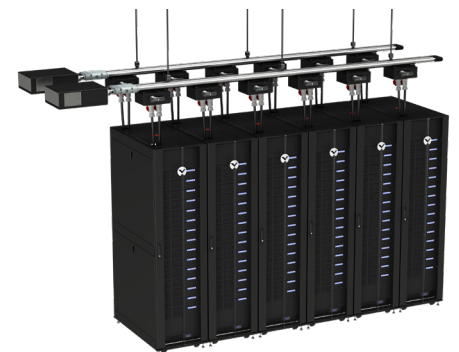
Centro de datos con el sistema Vertiv™ Powerbar iMPB