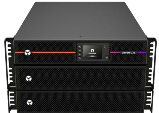
Vertiv™ Liebert® GXE 6 kVA mostrado con un armario de baterías externas 2U opcional