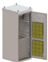
Kit interno contra vandalismo

Para garantir a integridade física dos gabinetes outdoor é importante contar com uma proteção contra vandalismo. Os gabinetes outdoor da Vertiv podem ser integrados com kit antivandalismo interno ou externo. Os kits internos são projetados para proteger o compartimento de baterias e para casos mais extremos, pode ser considerado o kit externo que é formado por uma armação que envolve o gabinete, protegendo todo o sistema contra vandalismo.