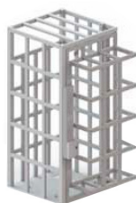
Kit externo contra vandalismo