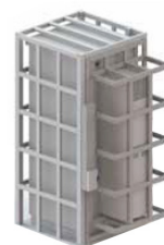
Gabinete com kit externo contra vandalismo